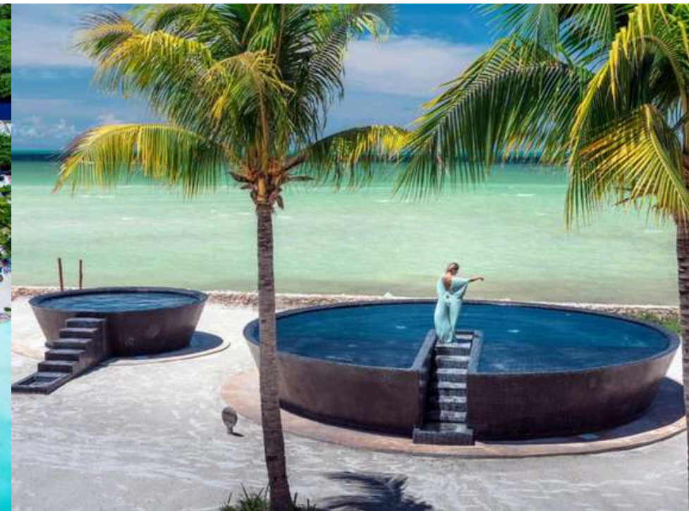
Villas HM Palapas del Mar + 174 €