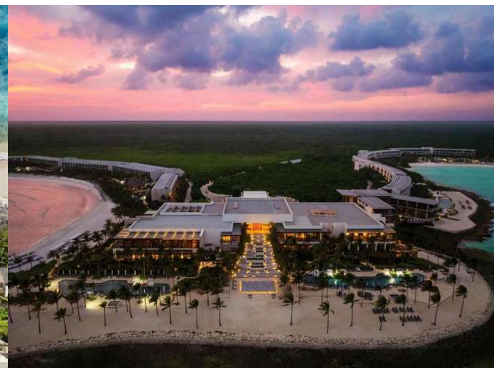
Ocean Riviera Paradise All Inclusive (Junior Suit Swim Up) + 174 €