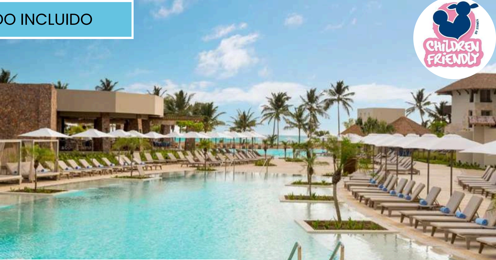
Dreams Playa Esmeralda Resort & Spa - All Inclusive +637 €