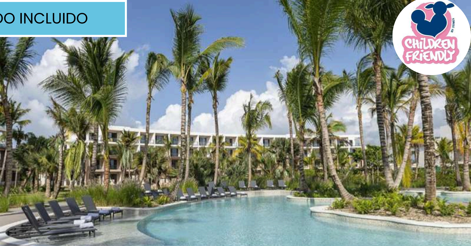
Zemi Miches Punta Cana All-Inclusive Resort, Curio by Hilton