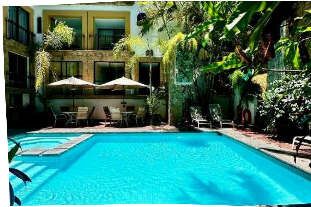
Hotel de Mendoza