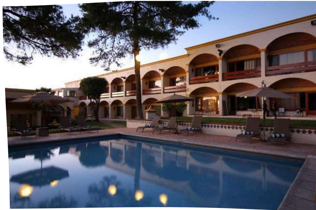
Imperio De Angeles