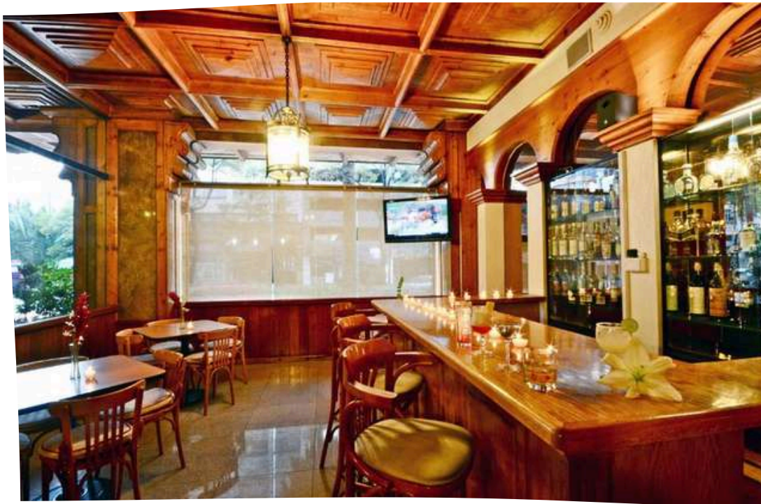
Plaza Florencia Ciudad de México