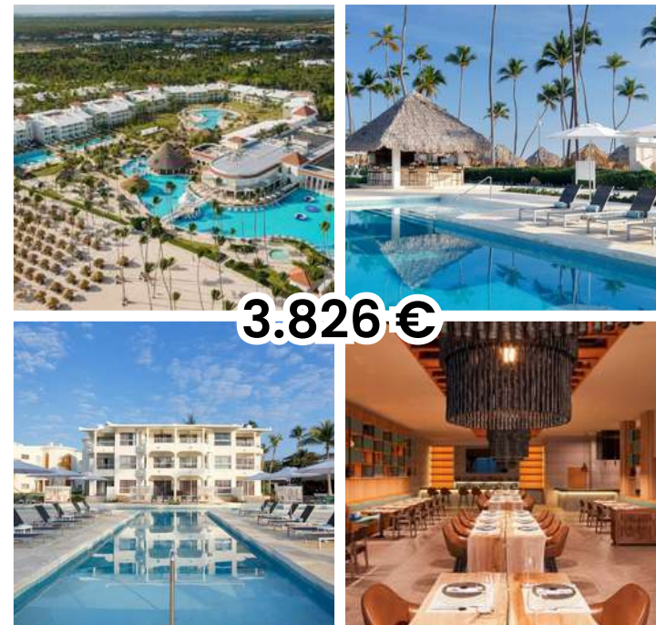
PARADISUS BY MELIÁ PALMA REAL