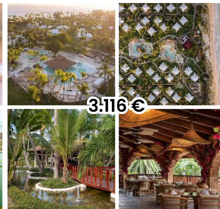
GRAND PALLADIUM SELECT BÁVARO