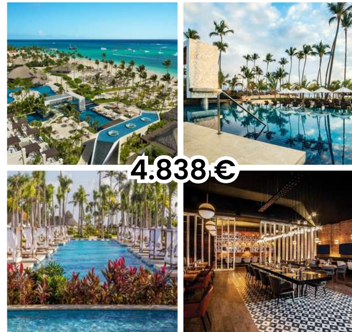
SECRETS ROYAL BEACH PUNTA CANA

¡Vamos a presentarte nuestra selección de alojamientos en diferentes gamas de precio. Resorts de lujo de 5 estrellas seleccionados por su servicio, ubicación e instalaciones, si tienes dudas en la selección, aquí estamos para orientarte en el mejor elección para ti. Como agencia especializada conocemos de primera mano tanot los hoteles como las actividades para completar LA EXPERIENCIA CARIBEÑA EN FAMILIA