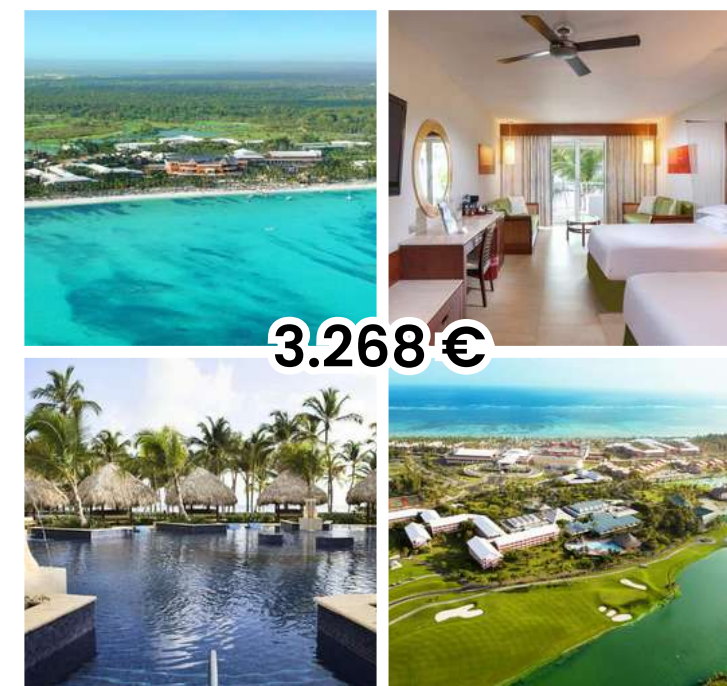
BARCELÓ BÁVARO PALACE