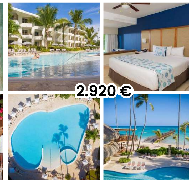
IMPRESSIVE PREMIUM PUNTA CANA