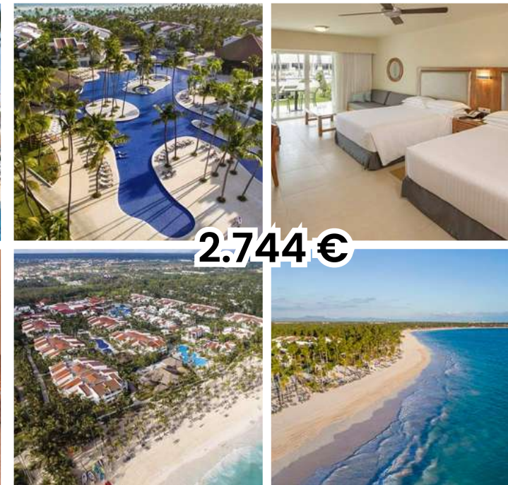
OCCIDENTAL PUNTA CANA