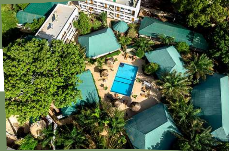
HOTEL LE BEDIK 3*