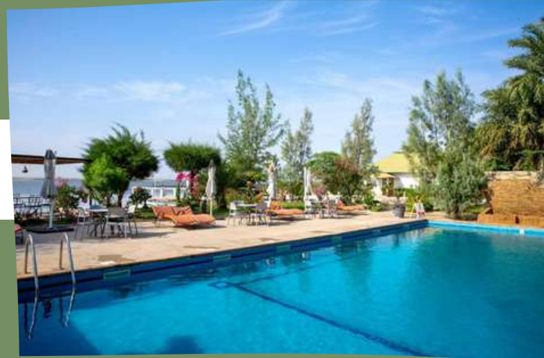
HOTEL RELAIS DE KAOLACK 3*