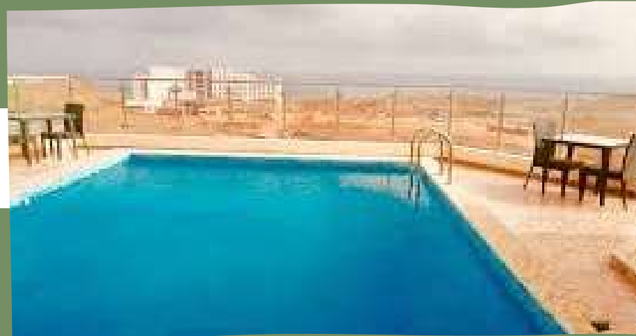
H. COLONIA 3*