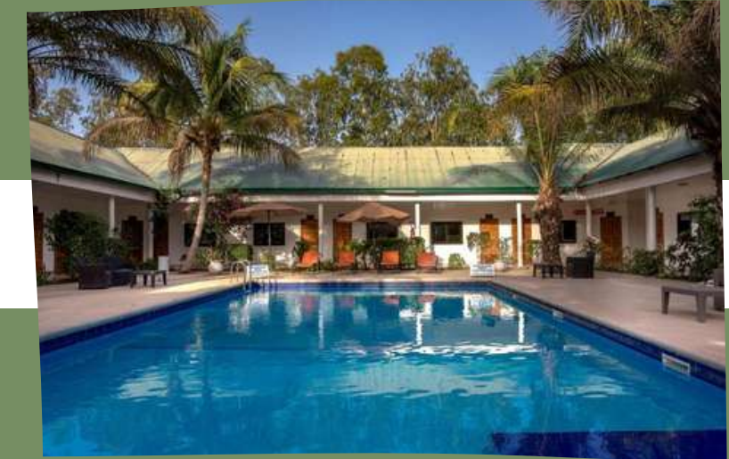
HOTEL MALAIKA 3*