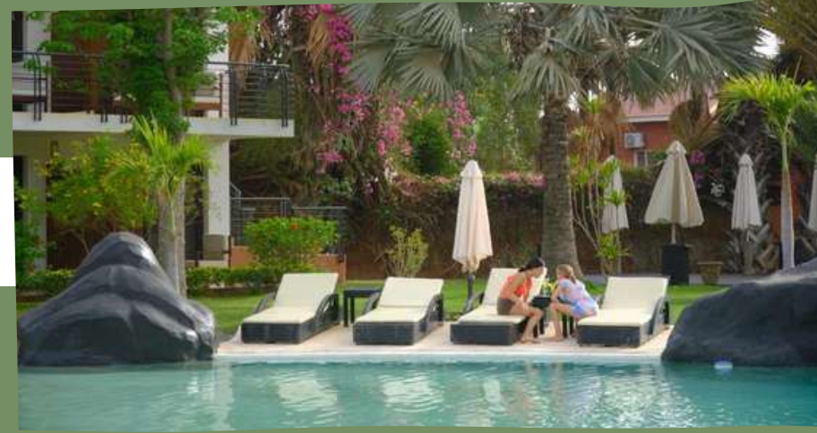
HOTEL AFRICA QUEEN 3*