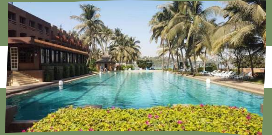
H. FLEUR DE LYS 3*