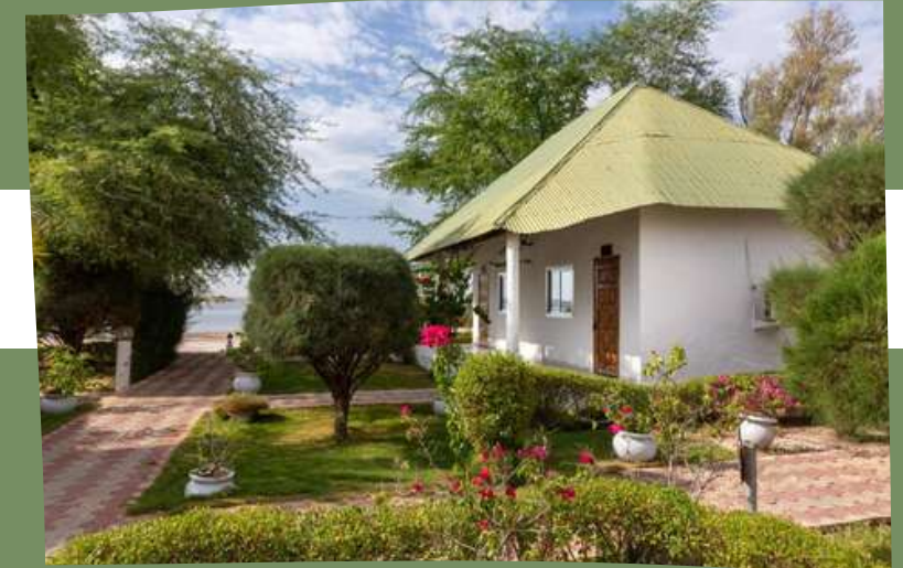
H. LE PARIS 3*