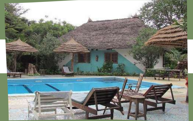
HOTEL LES COCOTIERS 3*