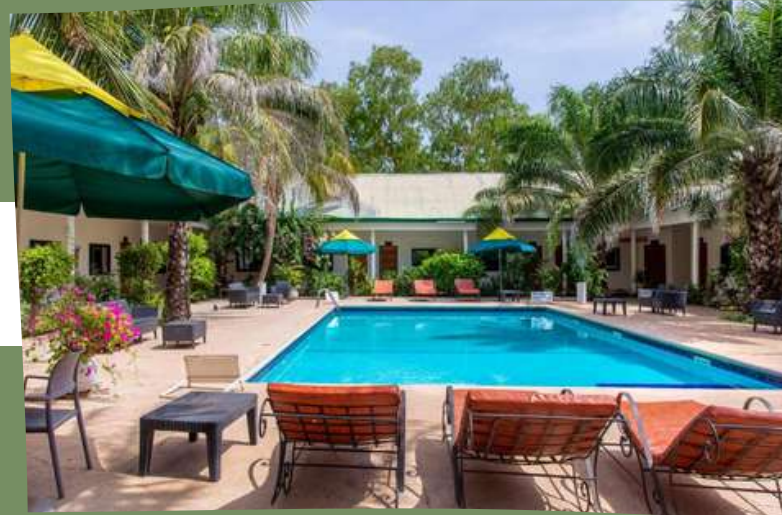
HOTEL RELAIS DE TAMBA 3*