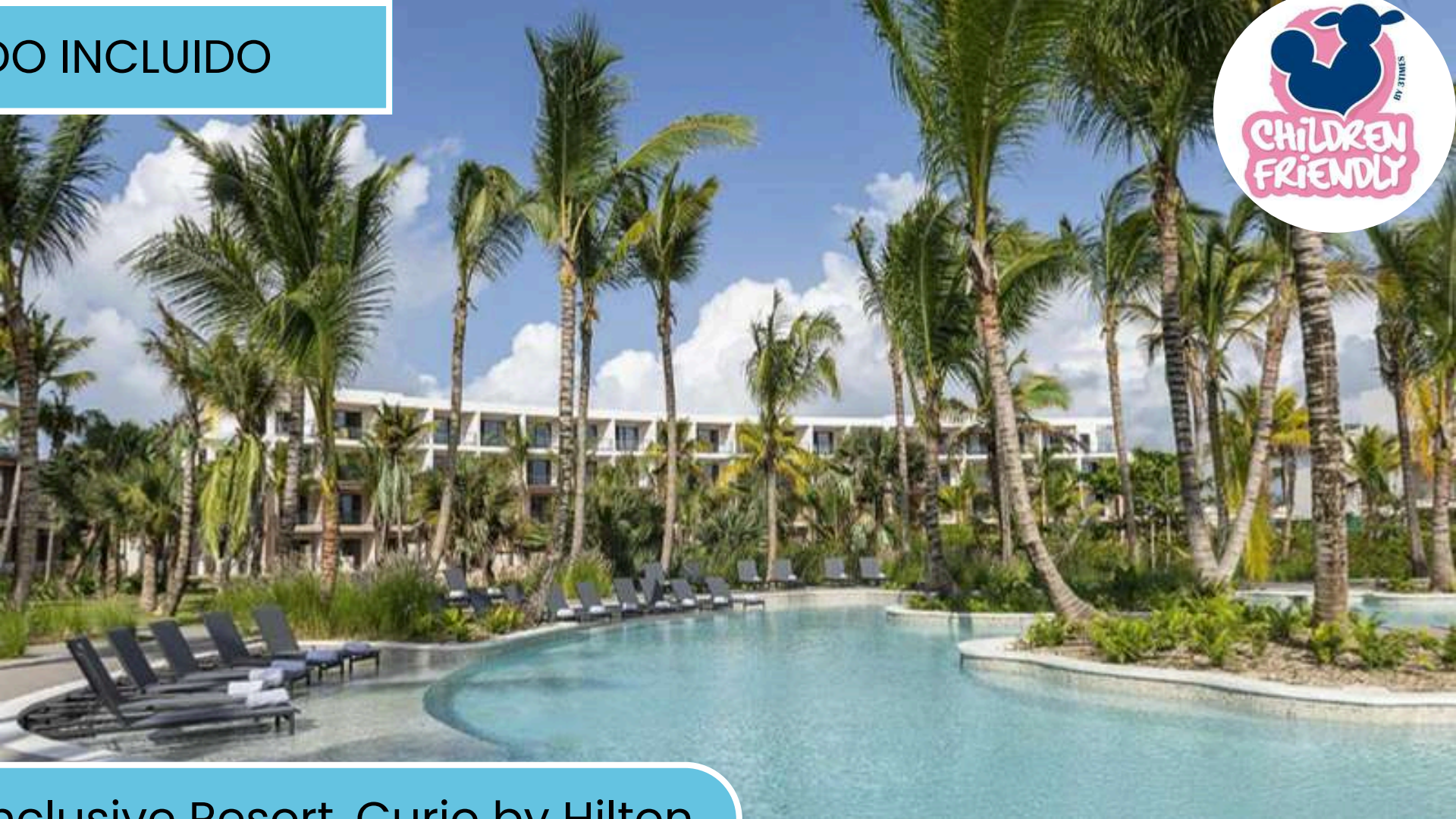
Zemi Miches Punta Cana All-Inclusive Resort, Curio by Hilton